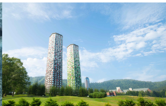
画像はすべてイメージです。